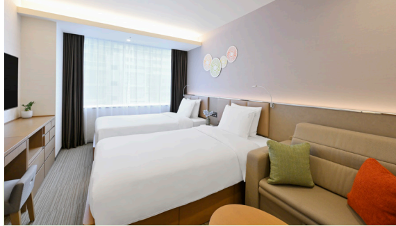
スタジオ・スイートツイン 〈広さ〉30m 2 〈ベッドサイズ〉120cm×200cm