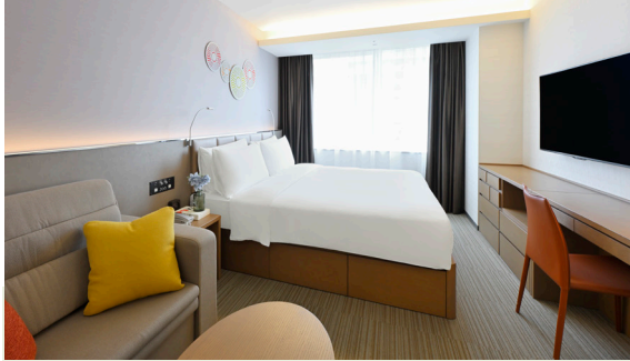
スタジオ・スイートキング 〈広さ〉30m 2 ~35m 2 〈ベッドサイズ〉200cm×200cm

フルキッチン・洗濯乾燥機付、独立型バスルーム完備で調理器具や食器も備えた広々スイートタイプ