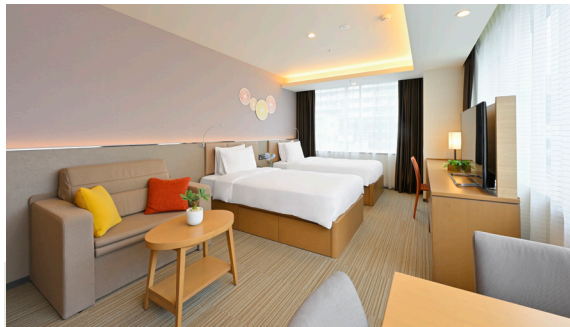
スタジオ・コーナースイートツイン 〈広さ〉45m 2 〈ベッドサイズ〉120cm×200cm