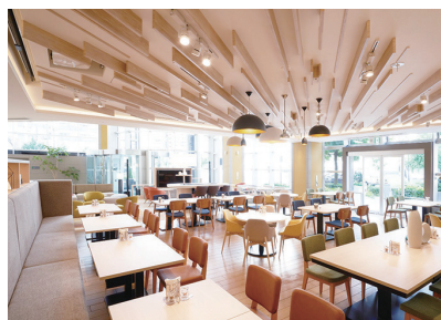
自然光の差し込む開放的なレストラン